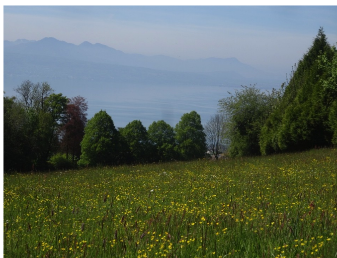
Panorama exceptionnel sur le Léman dû à un environnement champêtre intact