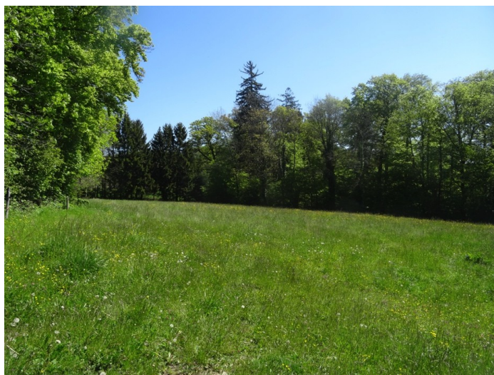
Prairie entourée de forêt classée en zone constructible