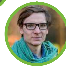
La campagne de Roveréaz