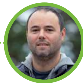
Antony Benoît La Jetée de la Compagnie