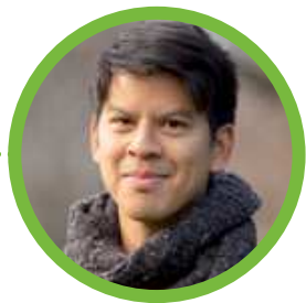
Ho Huy-Agnoc L'arrêt Barre du bus 16