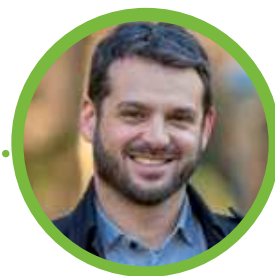
Vincent Rossi Le chemin des Falaises