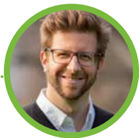
Etienne Raess Le Signal de Sauvabelin