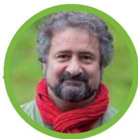
Yves Bonzon Le centre sportif de Pierre-de-Plan